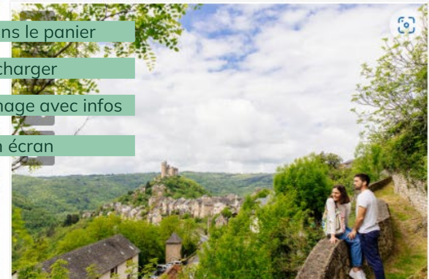
point de vue sur Najac

Place Notre-Dame , Villefranche de Rouergue