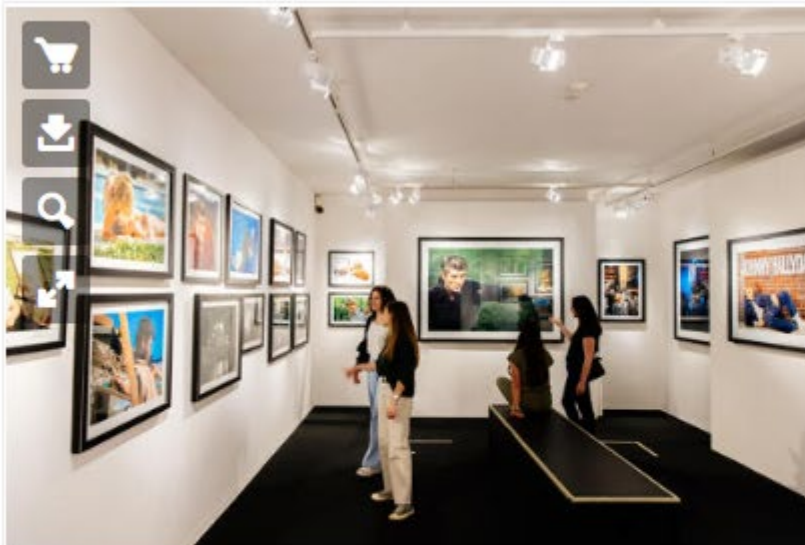
Galerie Jean-Marie Périer

Aveyron , Ouest Aveyron , Villeneuve d'Aveyron